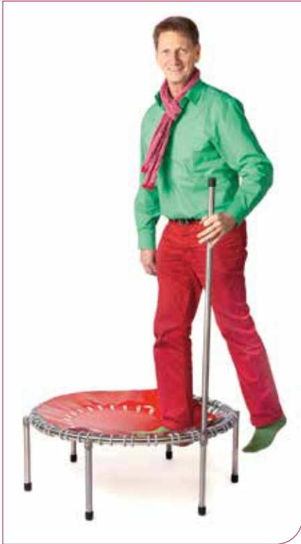
Abb. 2 Minitrampolin mit Haltestange.

Ein weiterer Effekt: Bei körperlichen Aktivitäten wie dem Trampolinschwingen setzt ein aktiver Pumpvorgang im Lymphsystem ein, wodurch die Lymphzirkulation um das 10- bis 30-Fache erhöht wird. Zelltrümmer, Giftstoffe, Bakterien und sonstige Abfallstoffe werden besser transportiert – der Körper kann leichter entgiften.